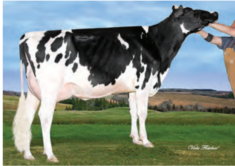
カブロン マブリー フィーバー 409 GP83