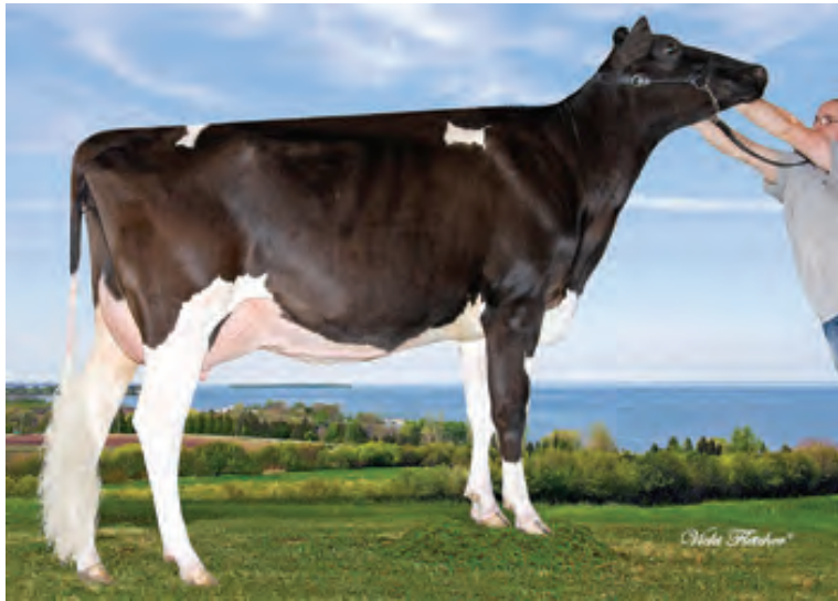
リアトリス ジョーダン メリル ET VG85

200H5575 ジョーダン娘牛 160 娘牛中 GP 以上 娘牛割合：74% (VG 娘牛 16 頭)