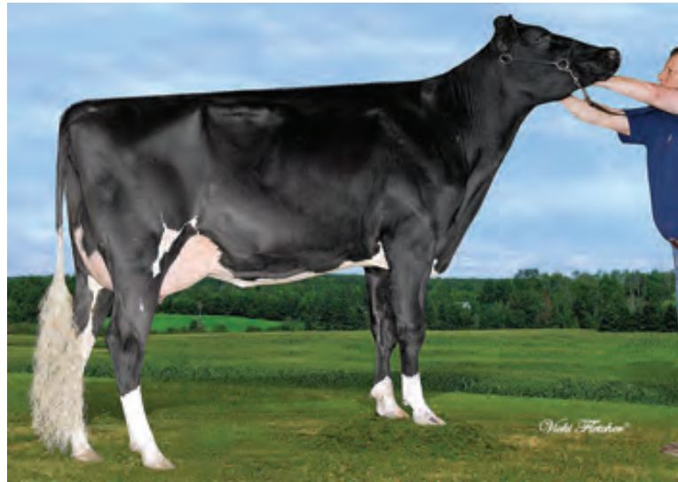
カンパーニャ ジョーダン ナリアン