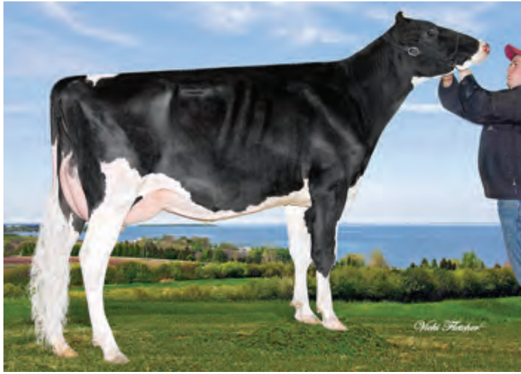
ボイリー シーバー カカウェット

200H5567 シーバー娘牛 71 娘牛中 GP 以上 娘牛割合：73% (VG 娘牛 3 頭)