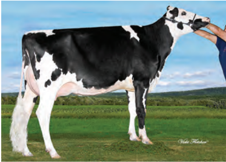
ラフジェール フィーバー キャシー VG88

200H5592 フィーバー娘牛 108 娘牛中 GP 以上 娘牛割合：87%（VG 娘牛 13 頭）