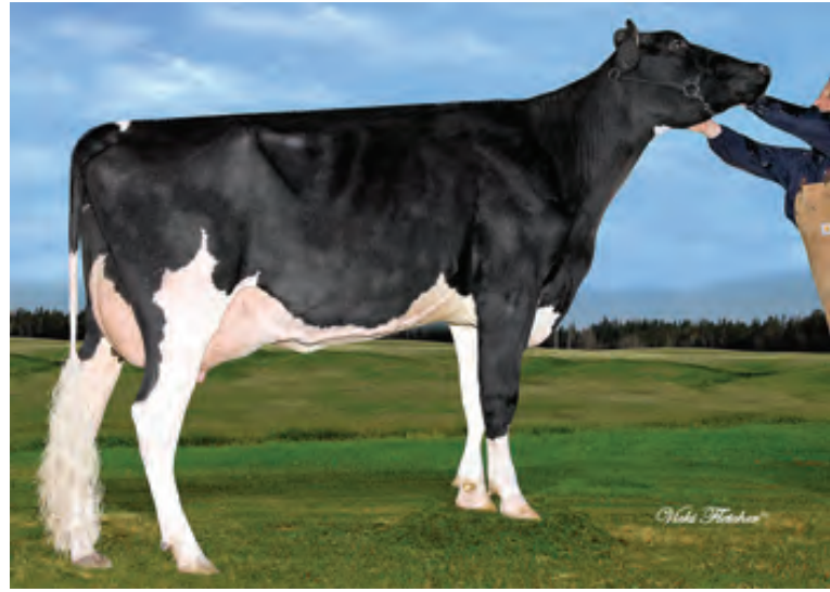
Rb タームリンシーバー サイバー

私たちは今回同時に数頭の 200H5562 デラバーシルレック、200H5584 フラリー マシーズ、200H3516 ギナリー ジャックの娘牛も見ることが出来ました。それらはどれもとても満足のいく魅力的な娘牛達でした。前述した種雄牛は全て 8 月に成績が公表される予定です。そして全ての酪農家の方々を満足させることの出来る体型指数と高い LPI 指数によりとてもエキサイティングなものとなるでしょう。