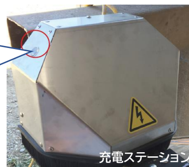
充電ステーション

充電ステーション横に設けられたウィンドウ部から充電状態が視認できメンテナンスの確認が容易にできます。